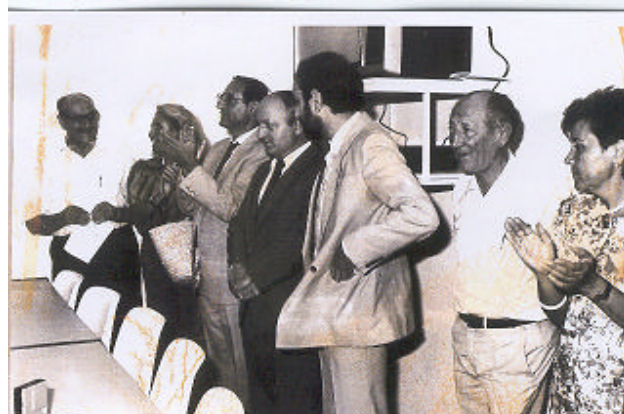
INAUGURACIÓN DEL NUEVO CLUB (12/9/1988)

Actividades Turísticas: 6 viajes a la playa subvencionados y viaje a Benidorm costeado por los asistentes.